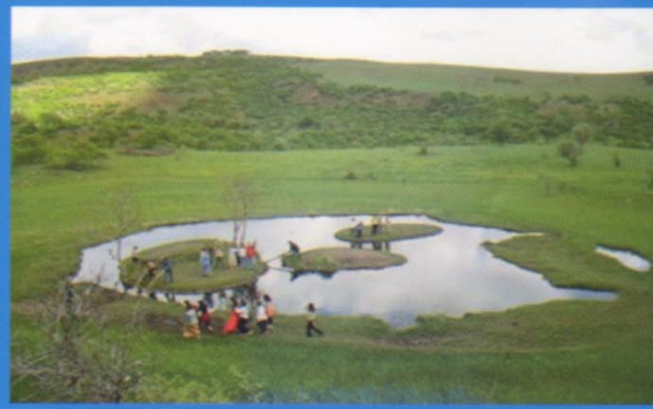
Bir doğa harikasıdır Solhan İlçesi'ndeki Yüzen Ada...