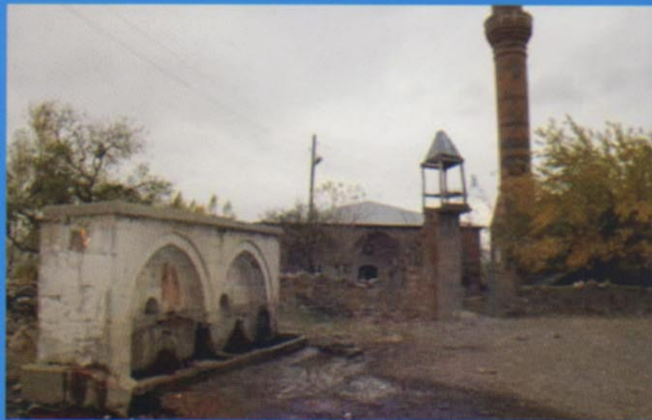
Adaklı İlçesi'nde Tarihi Camii ve Çeşme...