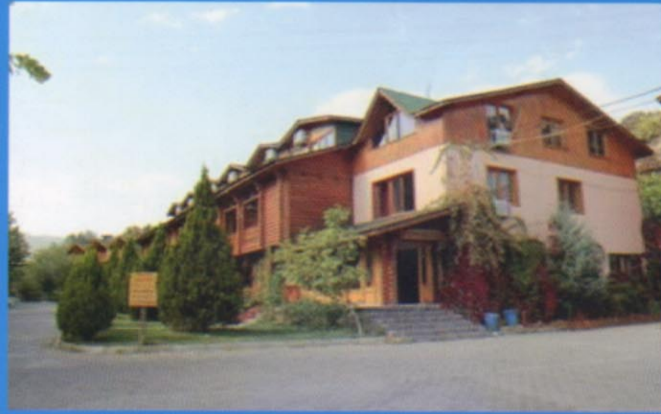
Bingöl sularının şifaya dönüştüğü BINKAP Kaplıcaları Termal tesisleri